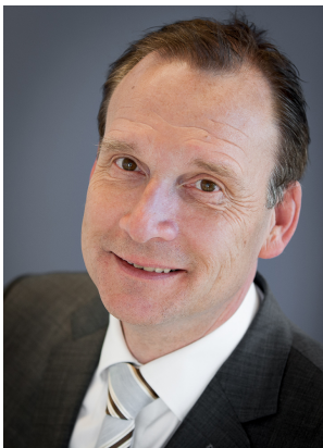
Voorzitter Stichting Pharmacon